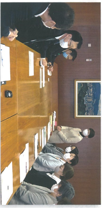
▶「子ども・子育て家庭への支援を求める緊急要望」を市民団体とともに提出。(5月20日、市役所市長会議室)

5月、緊急事態宣言が継続される中、休校や保護者の在宅ワーク等により、子育て家庭は子どもおとなも様々な影響を受け、特に、子どもたちが「友だちと遊べない」「公園でも周りを気にする」などストレスを抱えていることから、子育てをしながらNPO等で働いている方々を通して、子どもやおとなの声を聞き取りました。保護者が感染した場合、子どもの滞在先確保や心配な家庭への見守り体制の充実など7項目について要望しました。町田副市長から、「どのように工夫すれば、支援を拡充できるか相談させていただきたい」と回答がありました。