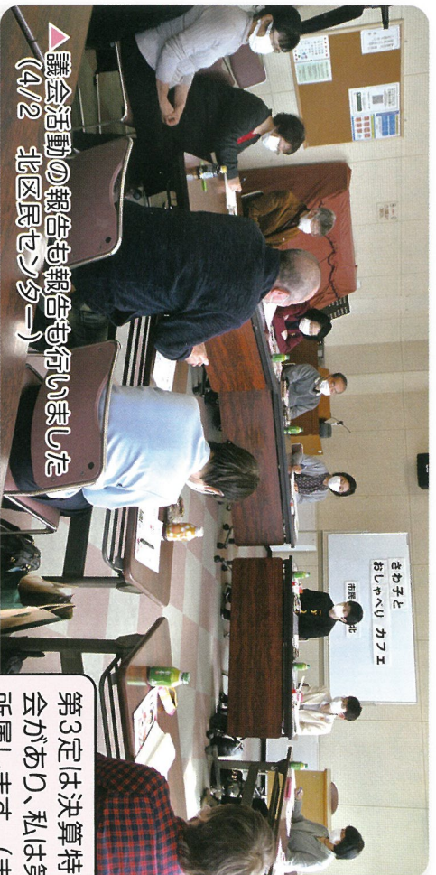
▼議会活動の報告も報告も行いました (4/2 北区民センター)

第3回は決算特別委員会があり、私は第1部に所属します。(まちづくり政策局、子ども未来局など)