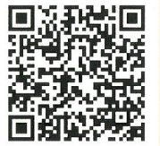
▲「HPVワクチンのほんとうのこと」リーフレットダウンロードQR

2022年4月からの接種勧奨再開にあたり、接種機会を逃した年代(9学年)に対象を拡大していますが、有効性とリスク等の情報を知り接種の可否を「選択すること」が重要です。