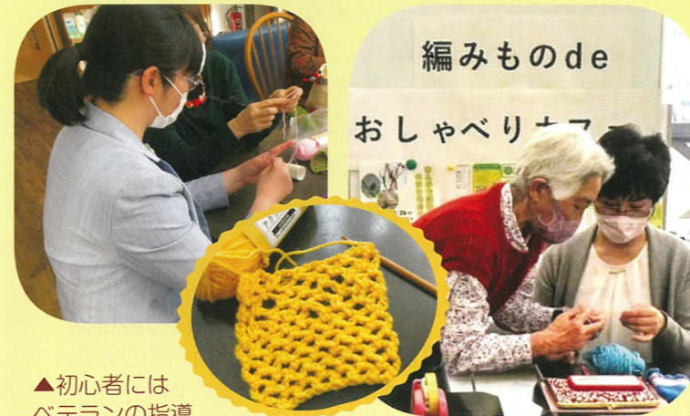
▲初心者にはベテランの指導つきで、12名の参加者が編み物を楽しみました。

かぎ針を使った簡単な編みものをしながら、おしゃべりカフェを開催しました。ごみ収集に関わるひと言から始まり、新たに広域処理施設ができることや分別方法の変更など、生活に身近な話題でおしゃべりが弾みました。