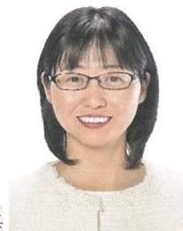
北広島市議会議員 佐々木ゆりか