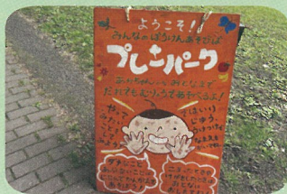
▲北海道大学で開催