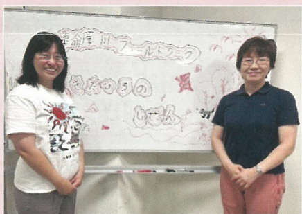
▲参加小学生の描いた生き物の絵と