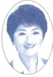
札幌市議会議員 米倉みな子 (札幌市北区)