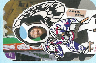
新琴似連合町内会の豊祭りにて

新琴似歌舞伎は、篠路歌舞伎とともに2024年3月に札幌市無形民俗文化財に認定されました。地域の財産である二つの農村の歌舞伎を伝え守っていくためのお手伝いをしたいと思っています。